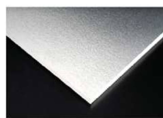
อลูมิเนียมฟอยล์